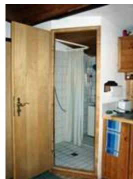
Eingang zum WC