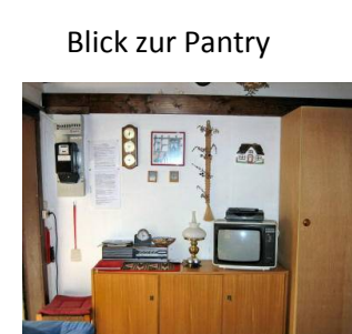
Blick zur Pantry