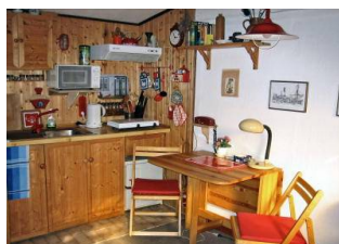
Blick zur Anrichte