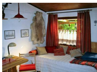
Blick zum Bett